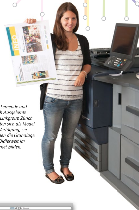
Vier Lernende und frisch Ausgelernte von Linkgroup Zürich stellten sich als Model zur Verfügung, sie werden die Grundlage der Bidlerwelt im Internet bilden.